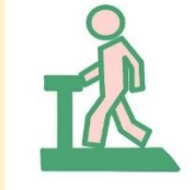
メタボ・ロコモ予防