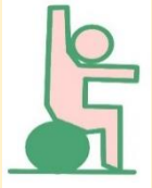
アスリート強化 パフォーマンス向上

メディカルフィットネスが提供する範囲は、「リハビリ」・「介護・介護予防」・「生活習慣病改善」・「メタボ・ロコモ予防」・「健康維持・増進」・「アスリート強化、パフォーマンス向上」と幅広い分野に及びます。